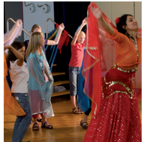
Tanzen: 20-30 Kinder