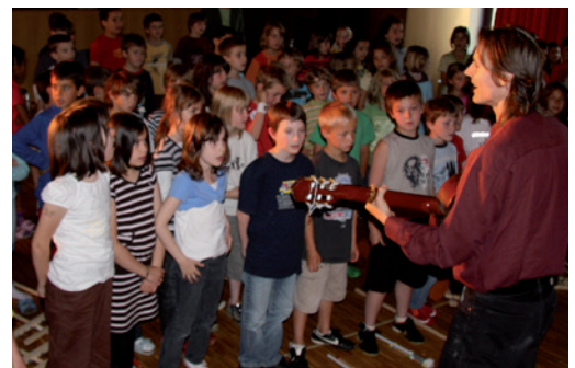
Singen: 50-100 Kinder