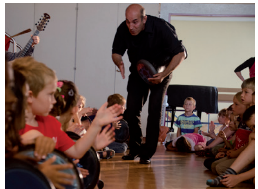
Trommeln: 20-30 Kinder