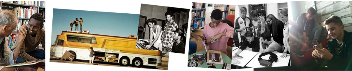
Bilder aus einer Umsetzung zum Thema "Rockmusik" in Solothurn

Die Lehrpersonen erhalten ein didaktisches Werkzeug zur selbständigen Weiterarbeit. Dazu gehört ein Begleitlehrmittel mit Übungen und Arbeitsblättern.