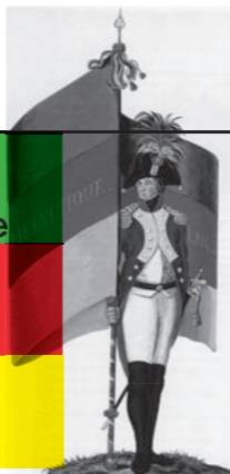
Bonaparte franchissant le Grand-Saint-Bernard (Jacques-Louis David, um 1800) St. Galler Fähnrich mit der Fahne der Helvetischen Republik (unbekannt, um 1800)