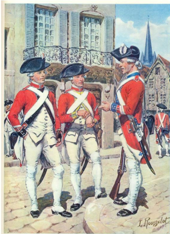
FUSILIERE DER SCHWEIZERREGIMENTEN VON ERNST, SALIS-SAMADEN UND DIESBACH gegen 1789

Nach einem Originalgemälde von Demmerle, im Musée des Arts, St. Pétersbourg, Paris.