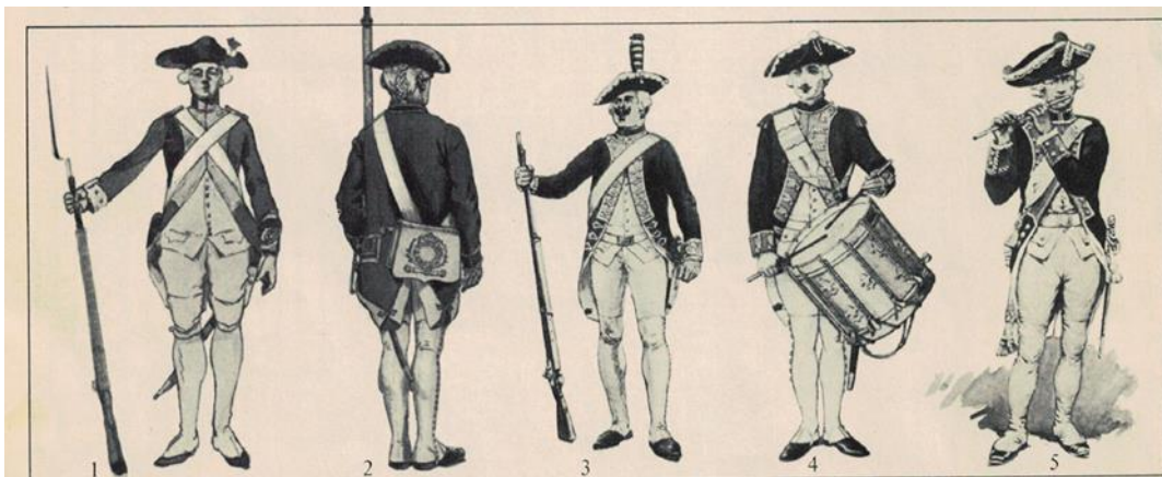
1. Fusilier, 2. Soldat de la compagnie générale 3. Canonnier 4. Tambour 5. Fife

Nach einem Originalgemälde von Demmerle, im Musée des Arts, St. Pétersbourg, Paris.